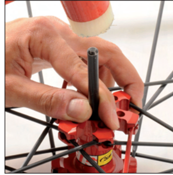
Lager mithilfe des Lager-Demontagewerkzeugs austreiben.