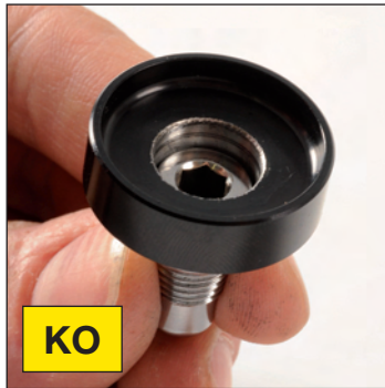
Laufrad-Halteschraube von der abgeflachten Seite auf die Distanzscheibe stecken (siehe Foto).