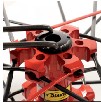
Lager-Abdeckkappe mithilfe des Stiftschlüssels aufschrauben (Anzugs-Drehmoment: 9 Nm).