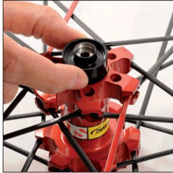
Distanzscheibe und Laufrad-Halteschraube abnehmen.